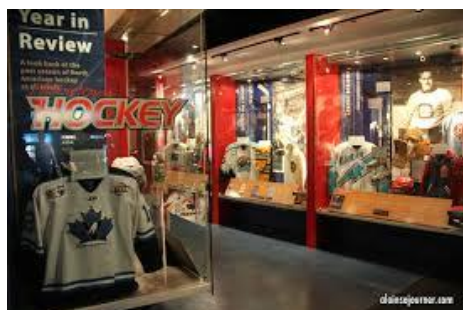
Hockey Hall of Fame

23/2 Lö. 10.00-12.00 Besök på Hockey Hall of Fame. Här finns all historia sparad från hockeys tidiga år, historia om ishockeyns utveckling i NHL, men även från Europa. Rundvandring på egenhand.